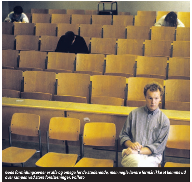
Gode formidlingsevner er alfa og omega for de studerende, men nogle lærere formår ikke at komme ud over rampen ved store forelæsninger.