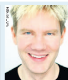
Bjørn Lomborg, miljødebattør