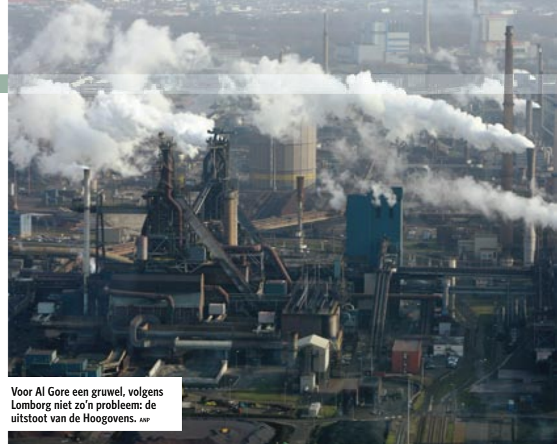
Voor Al Gore een gruwel, volgens Lomborg niet zo'n probleem: de uitstoot van de Hoogovens.

"Mensen die niet willen dat klimaatverandering een groot probleem is, lezen wat ze graag willen lezen: dat de beweringen van Al Gore voor een deel niet kloppen. Hij zegt dat de zeespiegel tot 6 meter kan stijgen, het wordt waarschijnlijk 30 centimeter. Anderen die in de klimaatverandering een ramp zien, ergeren zich juist vanwege datzelfde verschil tussen Gore en mij. Waar het om gaat: we moeten de middenweg vinden tussen ontkenning en alarmisme. Je moet je kop niet in het zand steken, maar je moet ook geen gekte creëren."