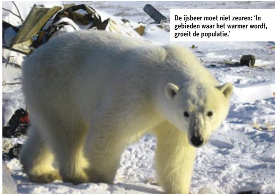
De ijsbeer moet niet zeuren: 'In gebieden waar het warmer wordt, groeit de populatie.'

"Neem het stijgen van het zeewaterniveau, dat bijvoorbeeld de Maldiven bedreigt, een eilandengroep in de Indische Oceaan. Waarschijnlijk zal de zee 30 centimeter stijgen tot eind deze eeuw, wat ruim 75 procent van het land zou wegvagen, als de bewoners er niets aan doen. Maar dat doen ze natuurlijk wel! De afgelopen anderhalve eeuw is het water ook 30 cm gestegen en