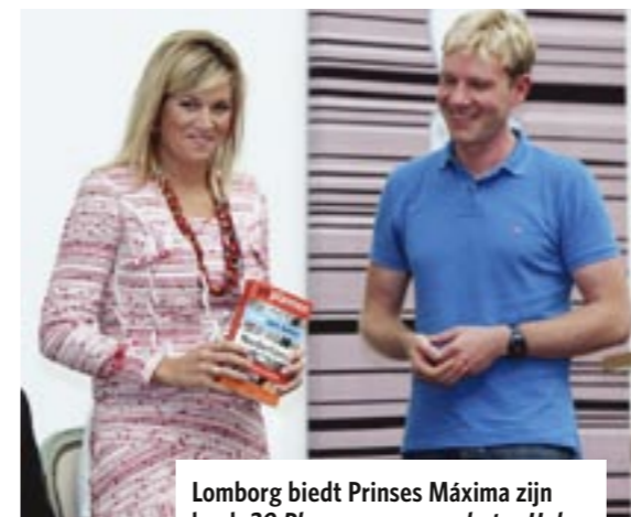
Lomborg biedt Prinses Máxima zijn boek 30 Plannen voor een beter Holland aan. Voor op het nachtkastje van 'waterprins' Willem-Alexander?

"Natuurlijk wel! Dat is een slimme manier om onnodig energieverbruik te vermijden, tegen weinig kosten. Isoleer je huis, breng zonnepanelen aan."