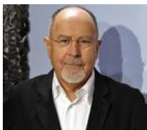
Arq EMPREDIMIENTO Edificios para la colectividad judía