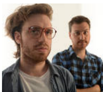
A un toque MIRÁ EL VIDEO La definición menos pensada