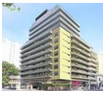
CONSTRUCCIÓN El empleo registra aumentos dispares